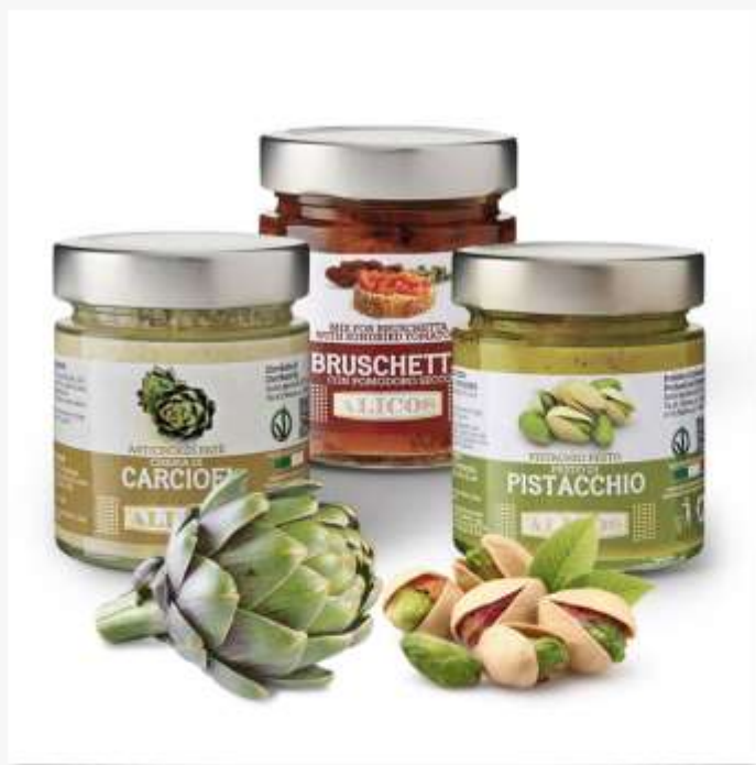
Tradizionale e biologico Conservas