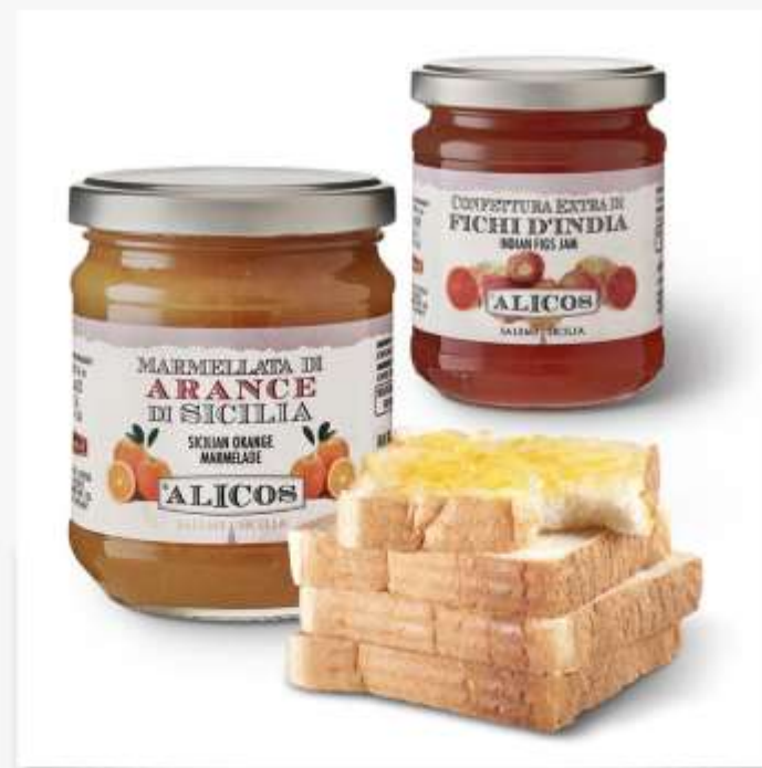
Confetture, marmellate e sciroppi