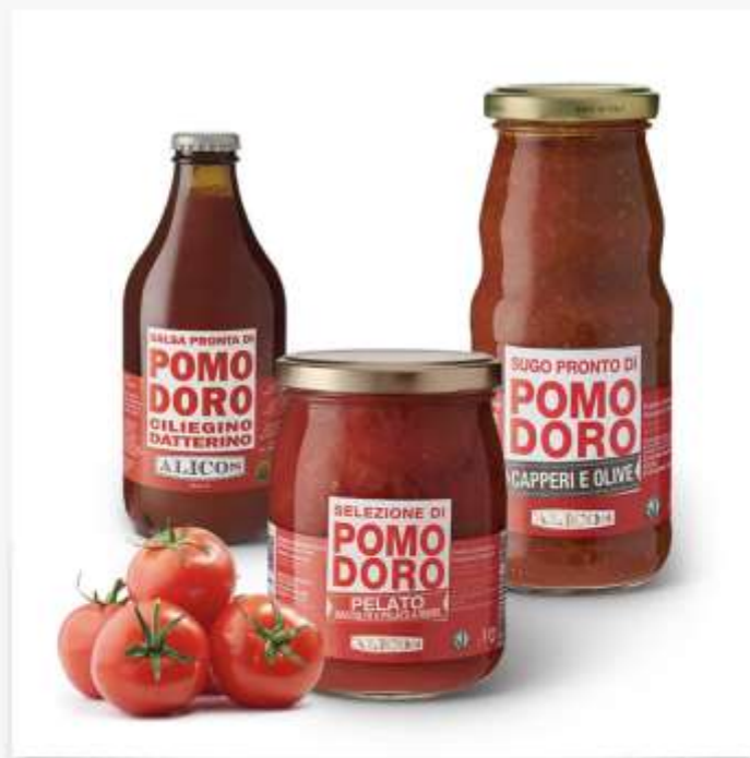
Tradizionale e biologico Salse